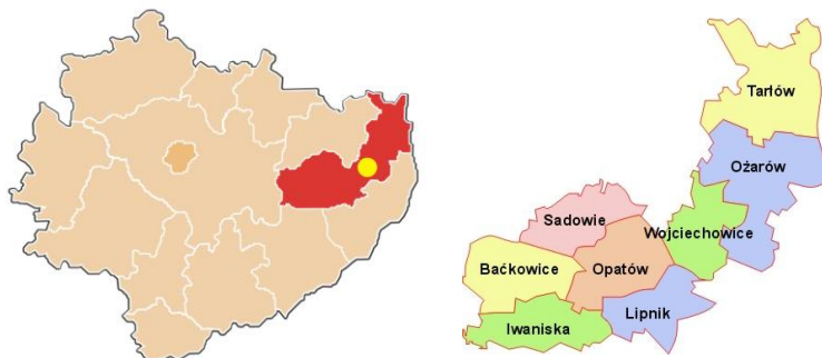
Położenie Wojciechowic w województwie i powiecie

Według danych GUS (stan na koniec 2009 roku) gminę zamieszkuje 5103 osoby. Gmina zalicza się do jednostek o rozproszonym systemie osadniczym, składa się z 15 sołectw.